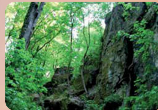
Damasa-tanösvény kiépítése, felszerelése, falumúzeum felújítása