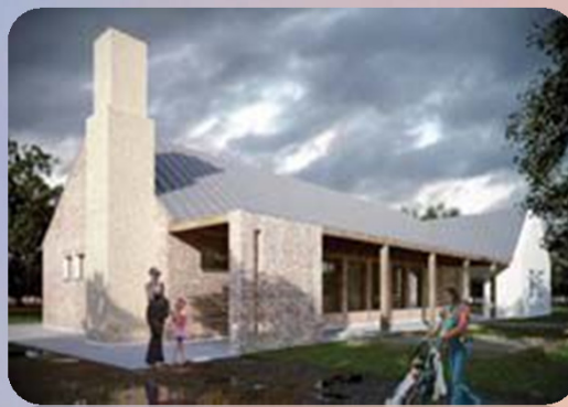
Rudapithecus Park és tematikus útvonal kialakítása Rudabányán