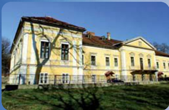
Kiállító-, konferencia és tehetséggondozó-központ, órakiállítás a Radvánszky-kastélyban