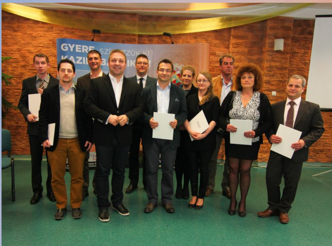
Az első pályázati kör nyertesei

A nyertes vállalkozások az új Üzleti, Szolgáltató és Inkubációs Parkban kerülnek elhelyezésre.